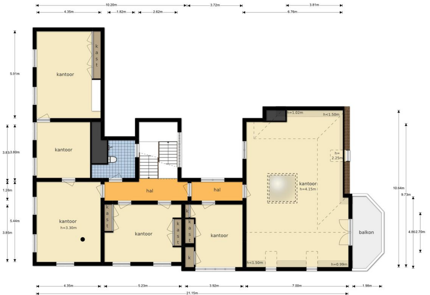
Zonnenburg 1 - Utrecht Eerste Verdieping

De plattegronden zijn geproduceerd voor promotionele doeleinden en ter indicatie. Aan de plattegronden kunnen geen rechten worden ontleend © www.objectenco.nl