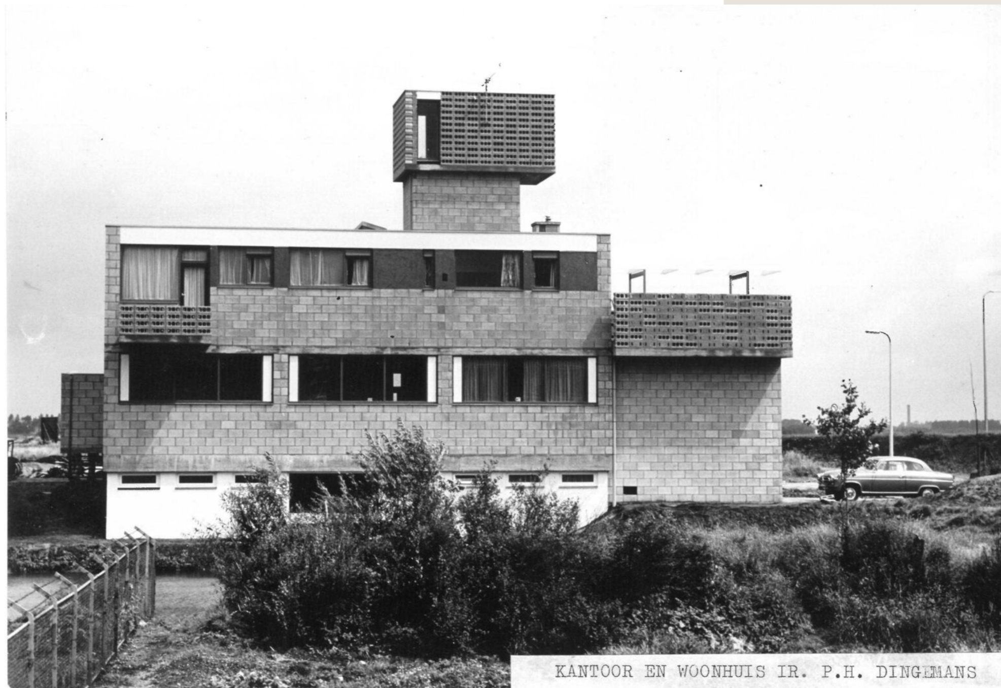
KANTOOR EN WOONHUIS IR. P.H. DINGEMANS

Het Dingemanshuys is ontworpen en gebouwd in de jaren '60 als vrijstaande villa met kantoor, door en voor de familie Dingemans. De tweede generatie Dingemans heeft het pand inmiddels verlaten en de monumentale voormalige woon-/werkvilla zal worden herontwikkeld. In het oude gedeelte van het pand komen drie stadsvilla's, bestaande uit twee verdiepingen. Op de verdieping zal het oorspronkelijke appartement geheel worden gemoderniseerd met behoud van de monumentale elementen. Kenmerkend voor het gebouw is de toren die het pand een unieke uitstraling geeft.